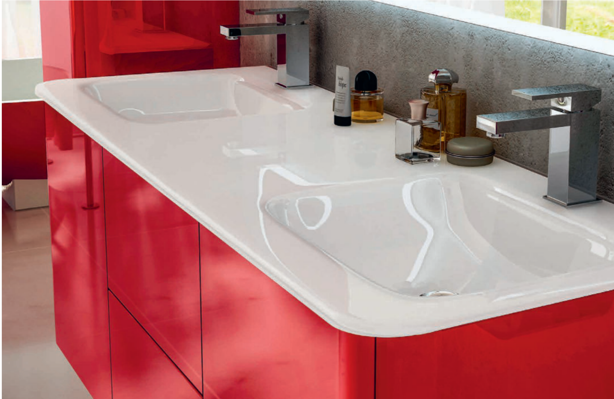
Rosso - Red - Rouge - Rot Liverpool