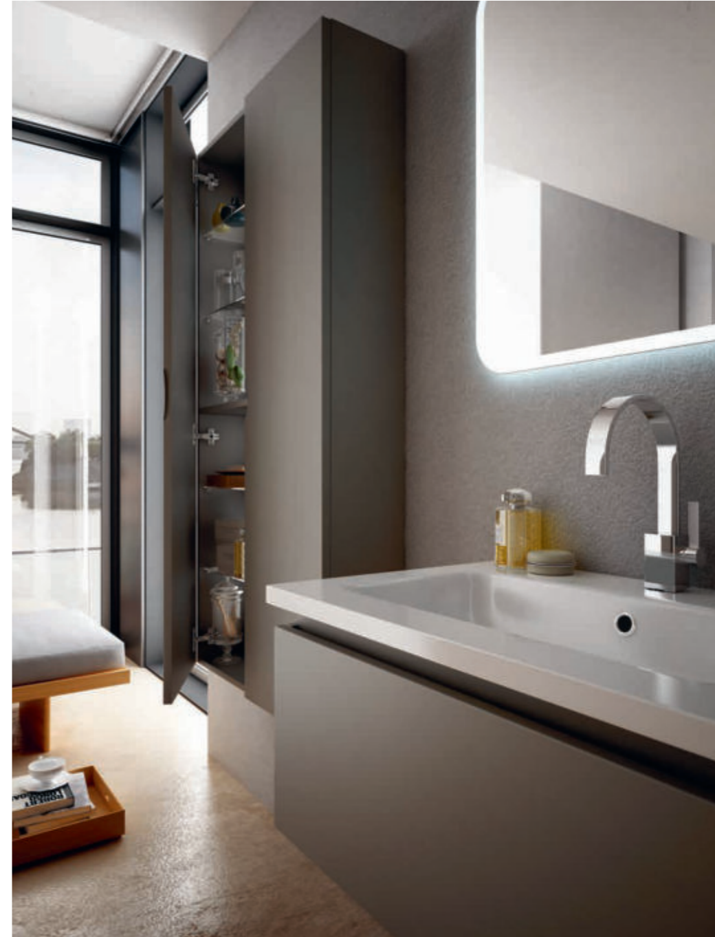
Grigio Talpa - Mole Gray - Gris Taupe - Talpagrau Avril