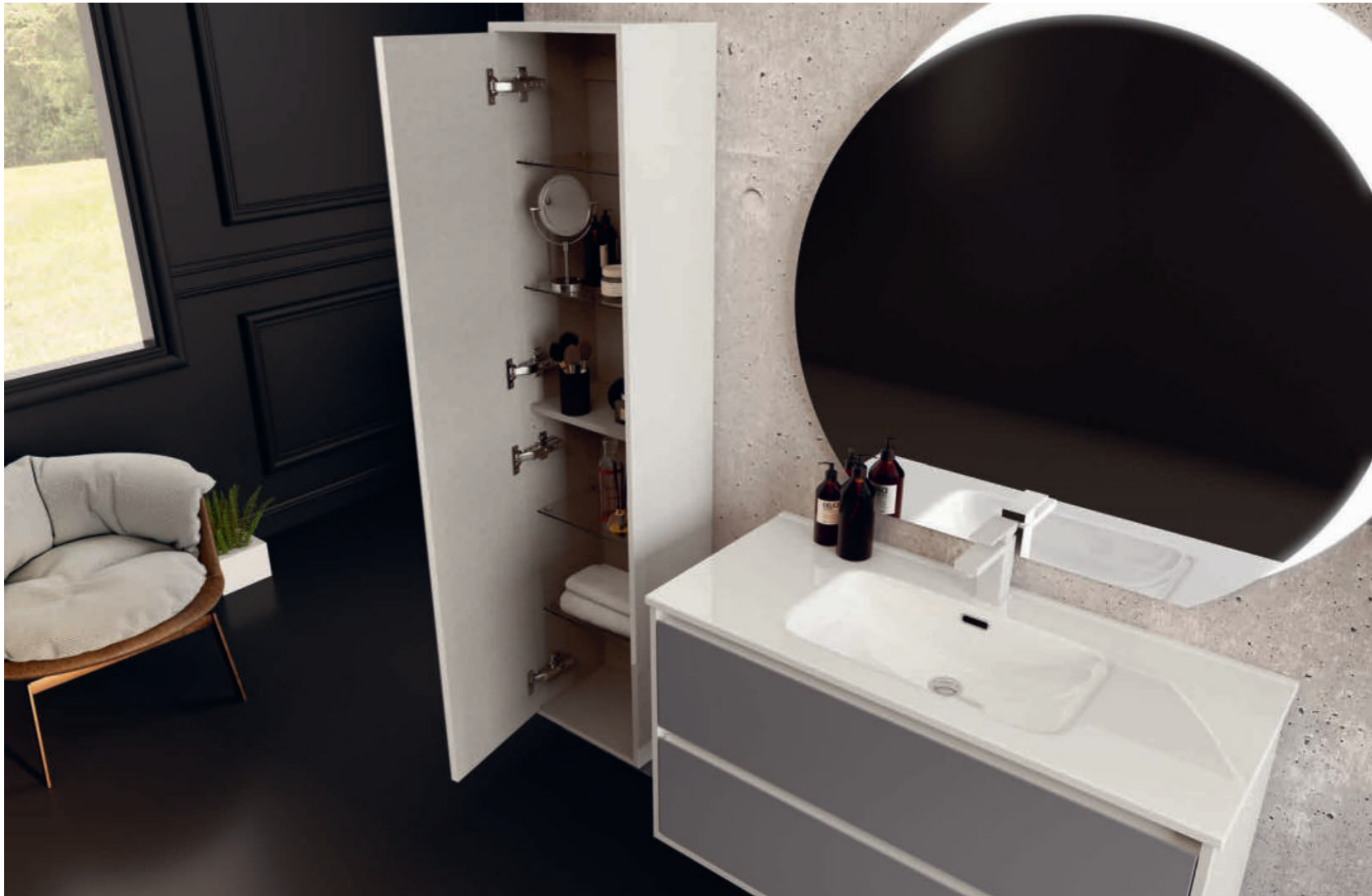
Bianco Lucido con frontali in vetro - Glossy White with glass doors - Blanc Brillant avec façades en verre - Weiß Hochglanz mit Glasfronten