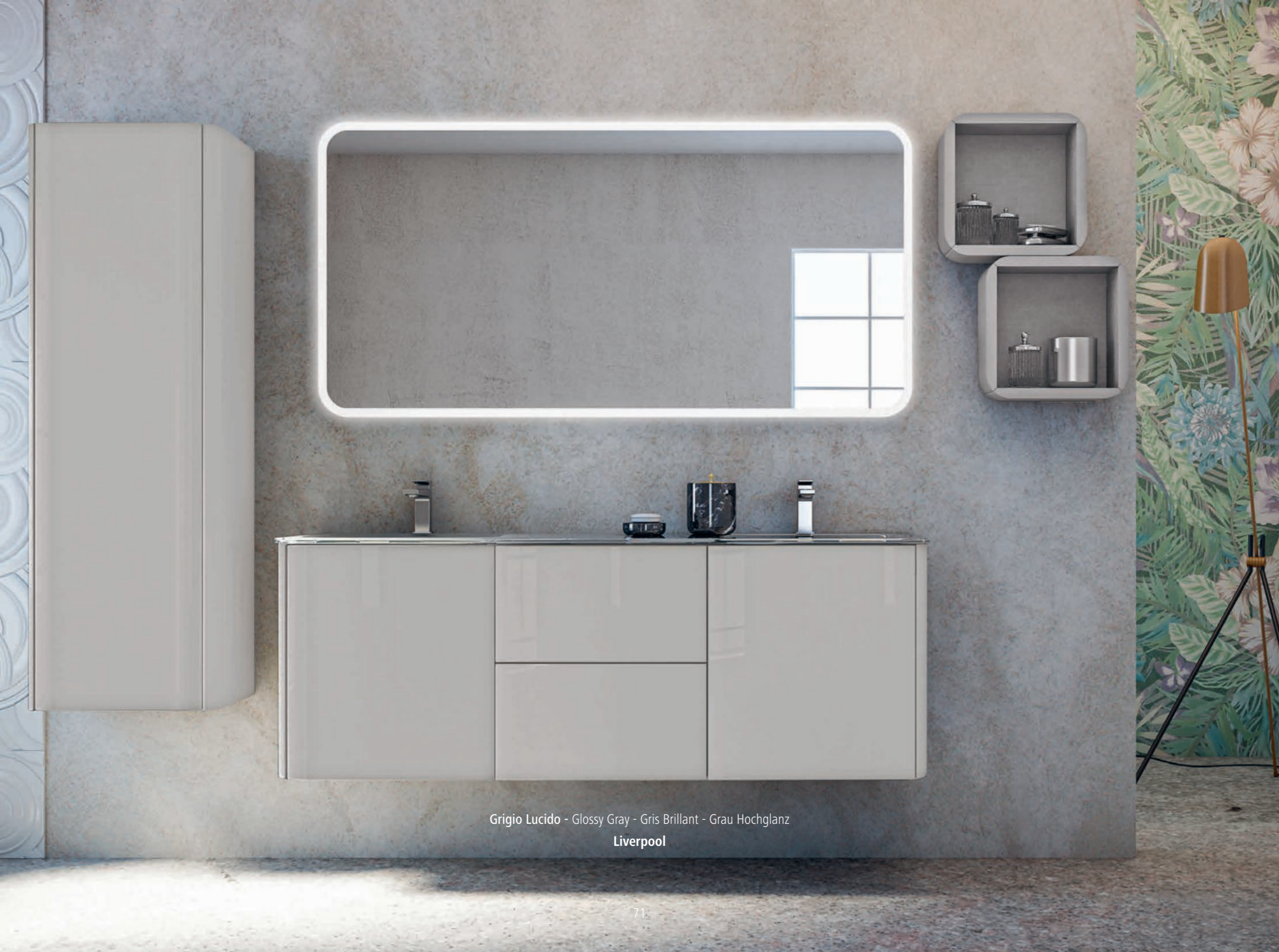
Grigio Lucido - Glossy Gray - Gris Brillant - Grau Hochglanz Liverpool