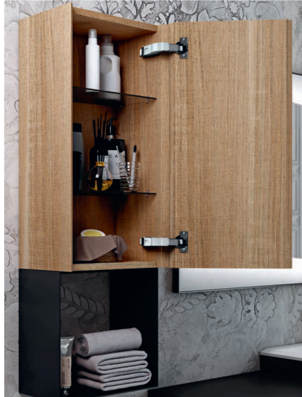
Rovere Bruges - Oak Bruges - Chêne Bruges - Eiche Bruges