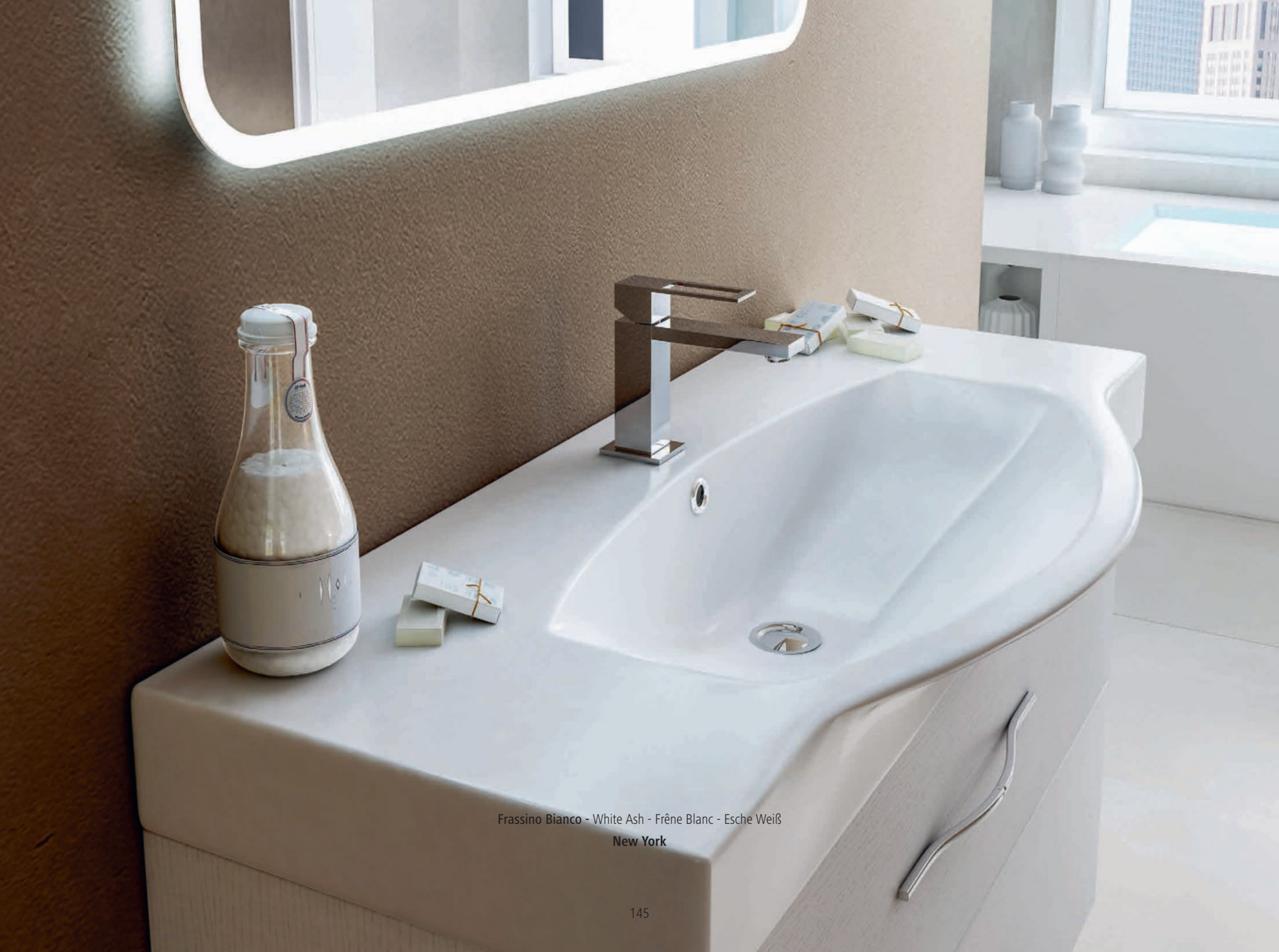
Frassino Bianco - White Ash - Frêne Blanc - Esche Weiß New York