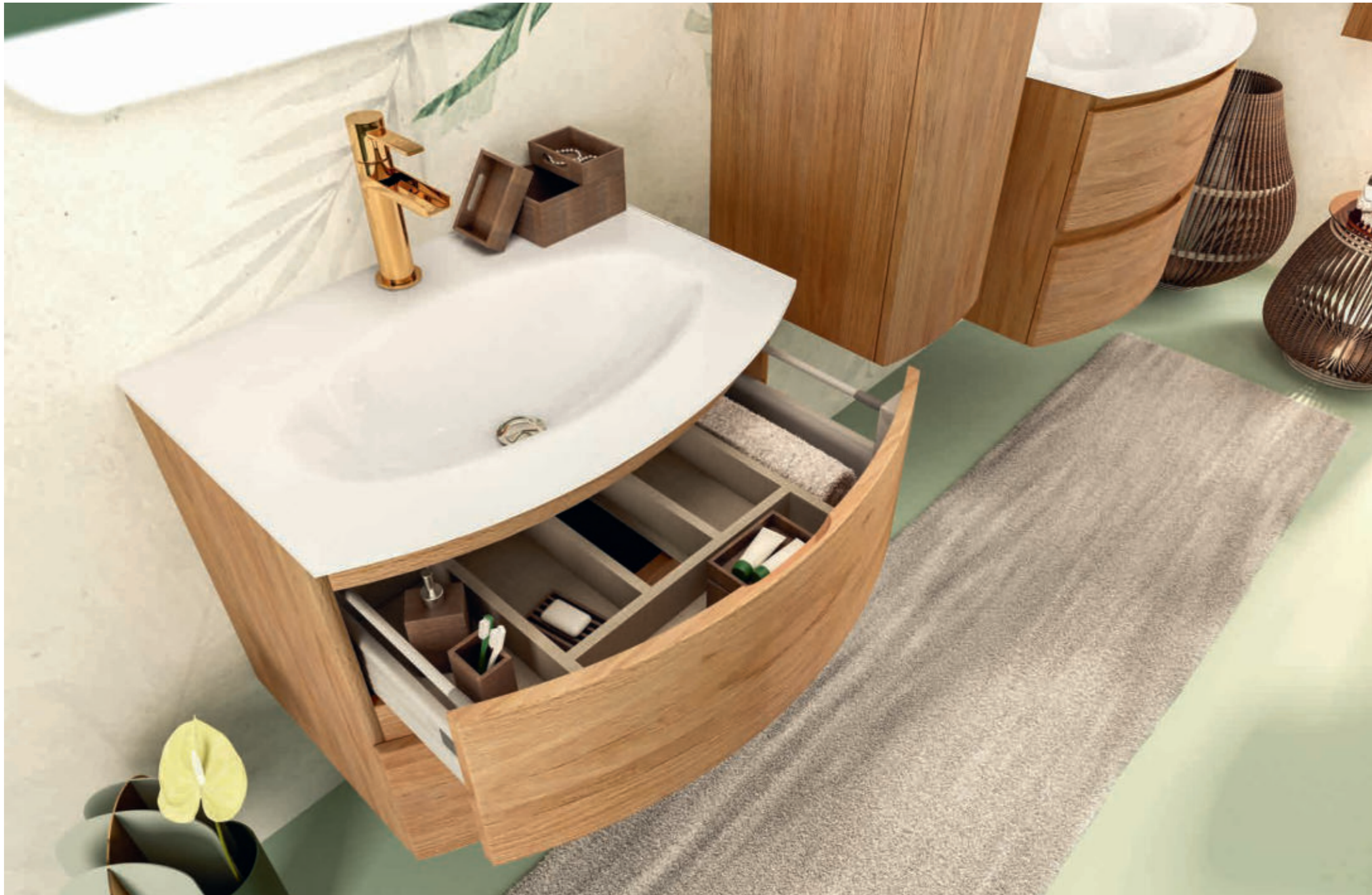
Rovere Tabacco - Tobacco Oak - Chêne Tabac - Tabakeiche Vague