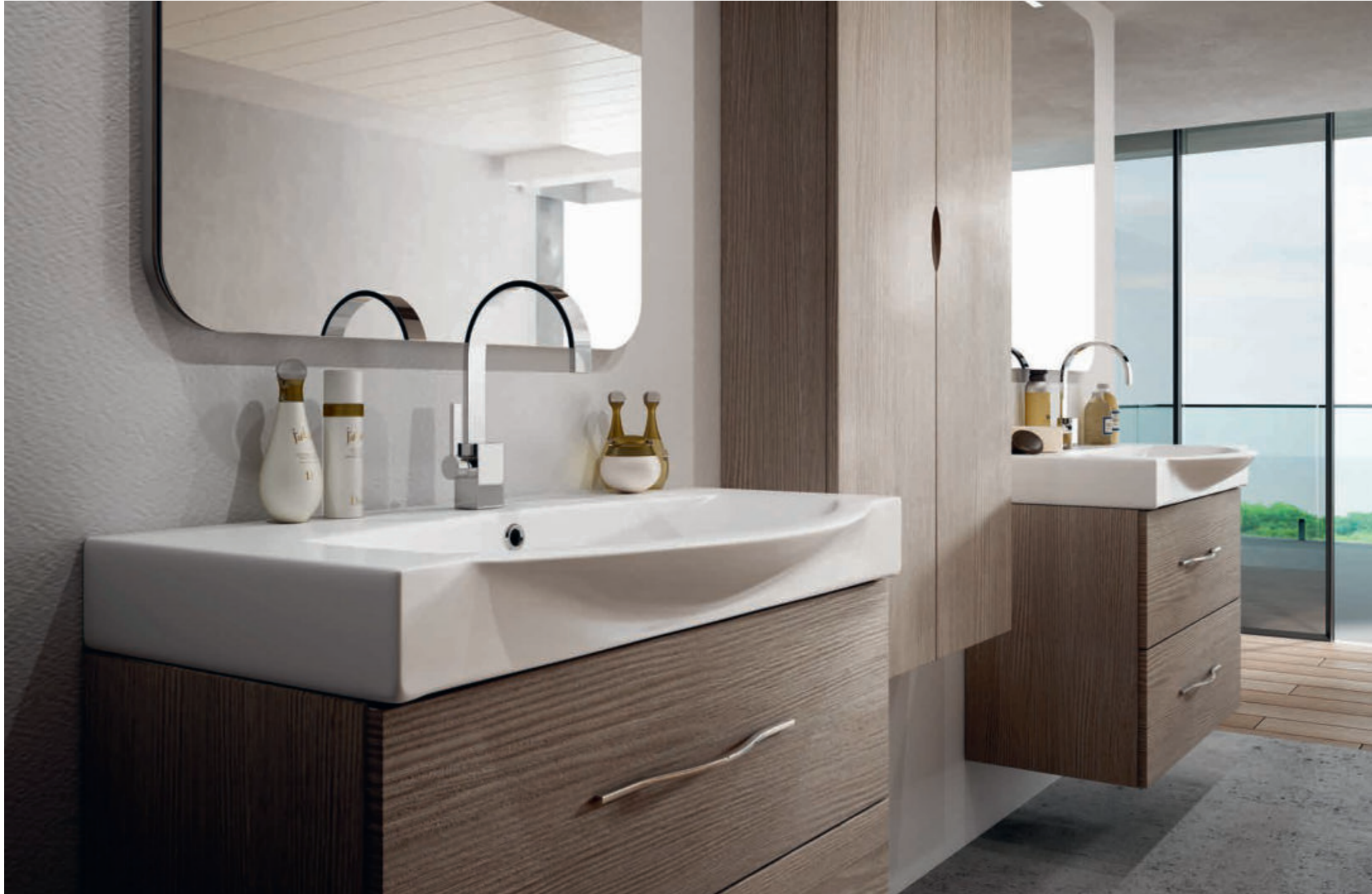
Larice - Larch - Mélèze - Lärche New York