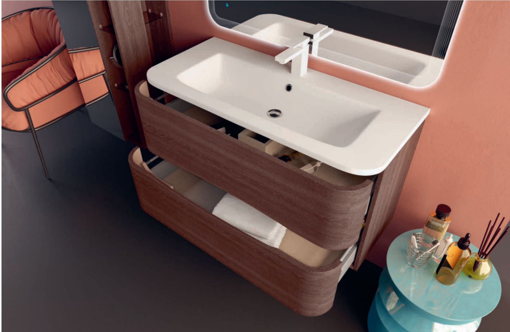
Rovere Scuro Soft - Dark Oak Soft - Chêne Foncé Soft - Eiche Soft Angie