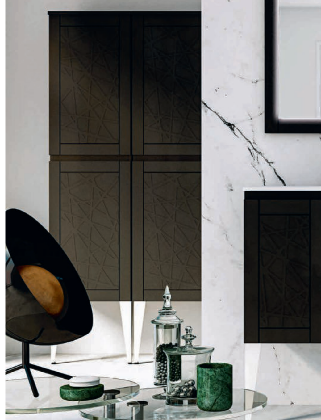
Grafite - Graphite - Graphite - Graphit America