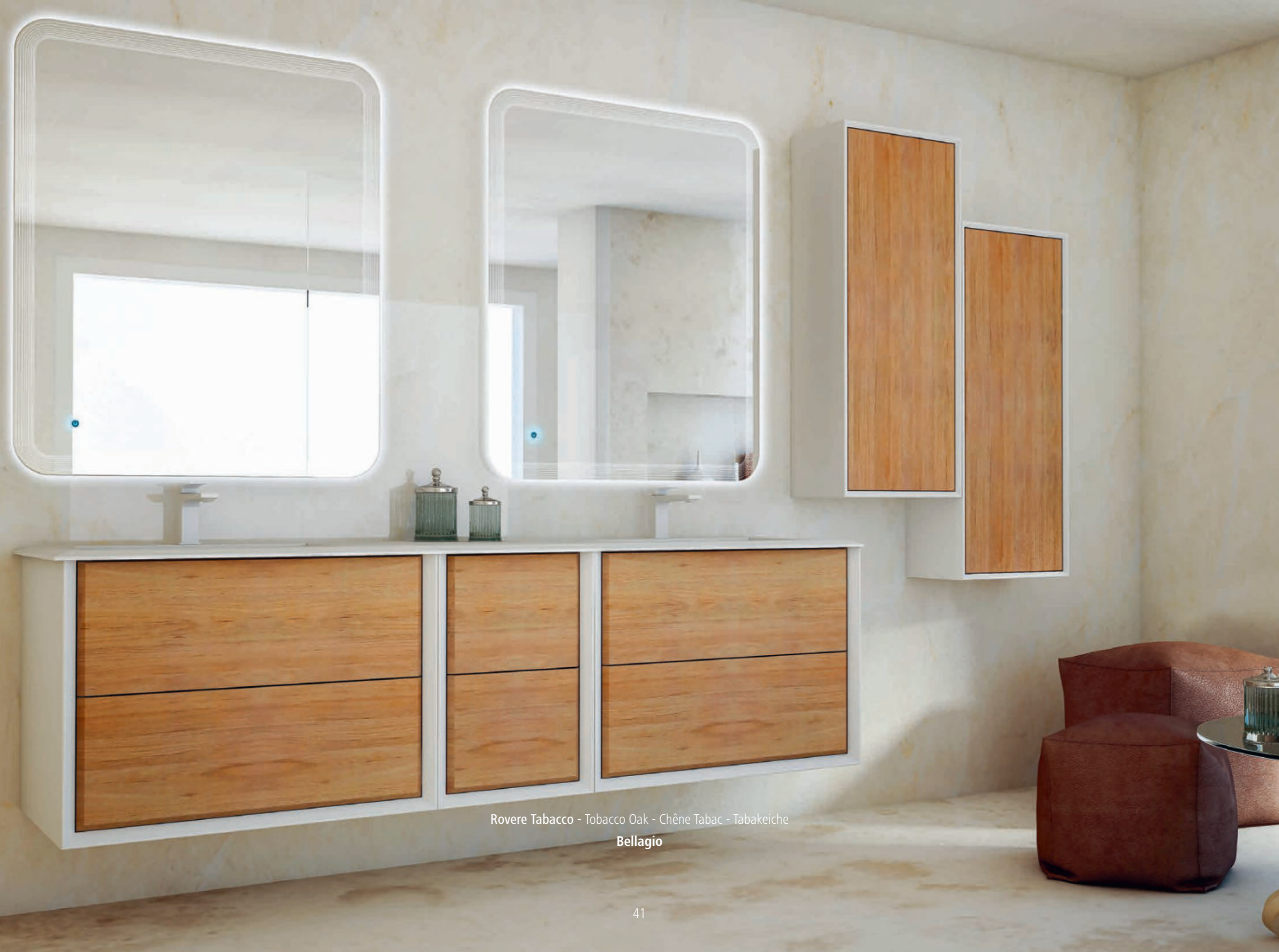
Rovere Tabacco - Tobacco Oak - Chêne Tabac - Tabakeiche Bellagio