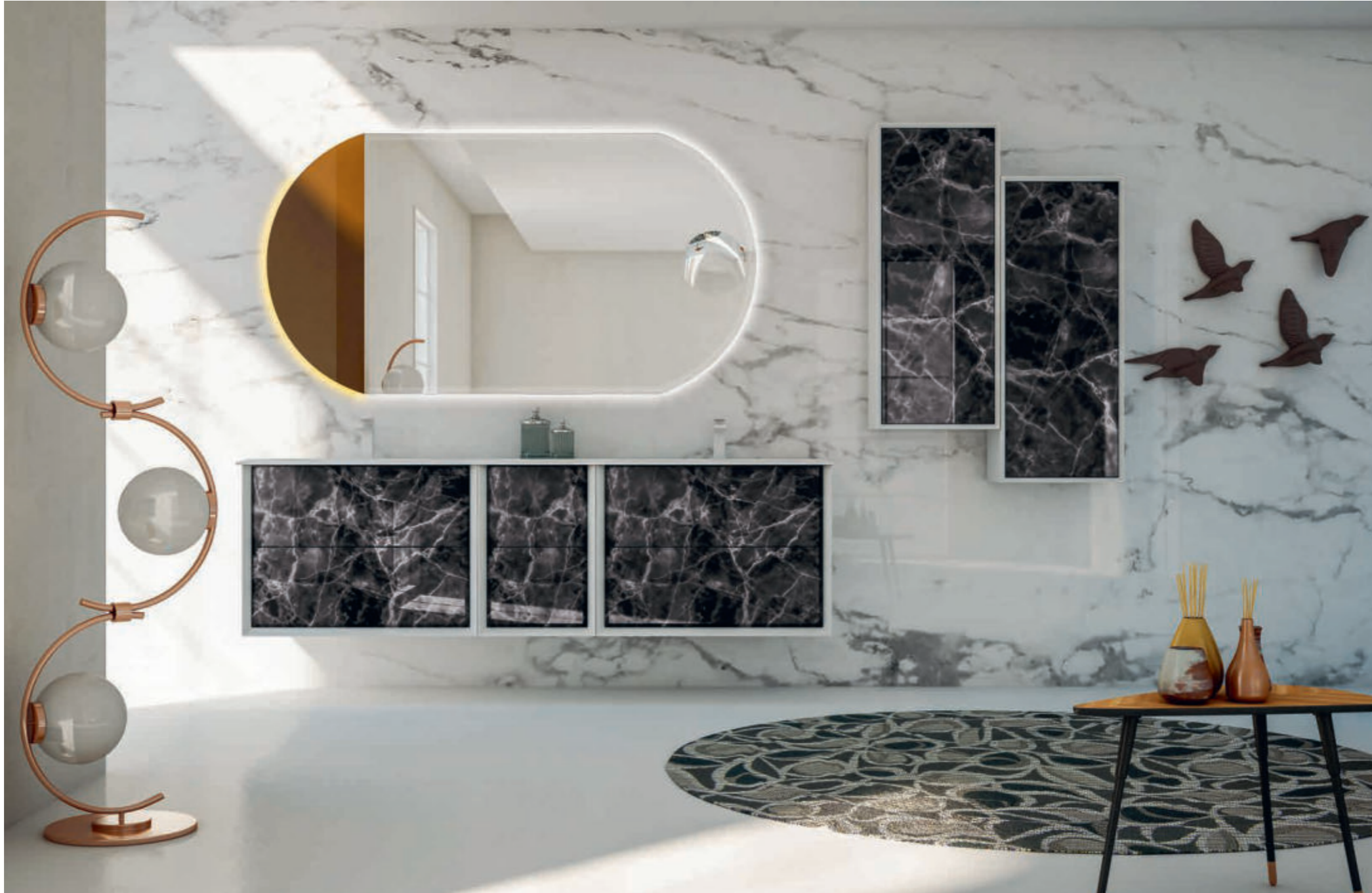
Black Stone Bellagio