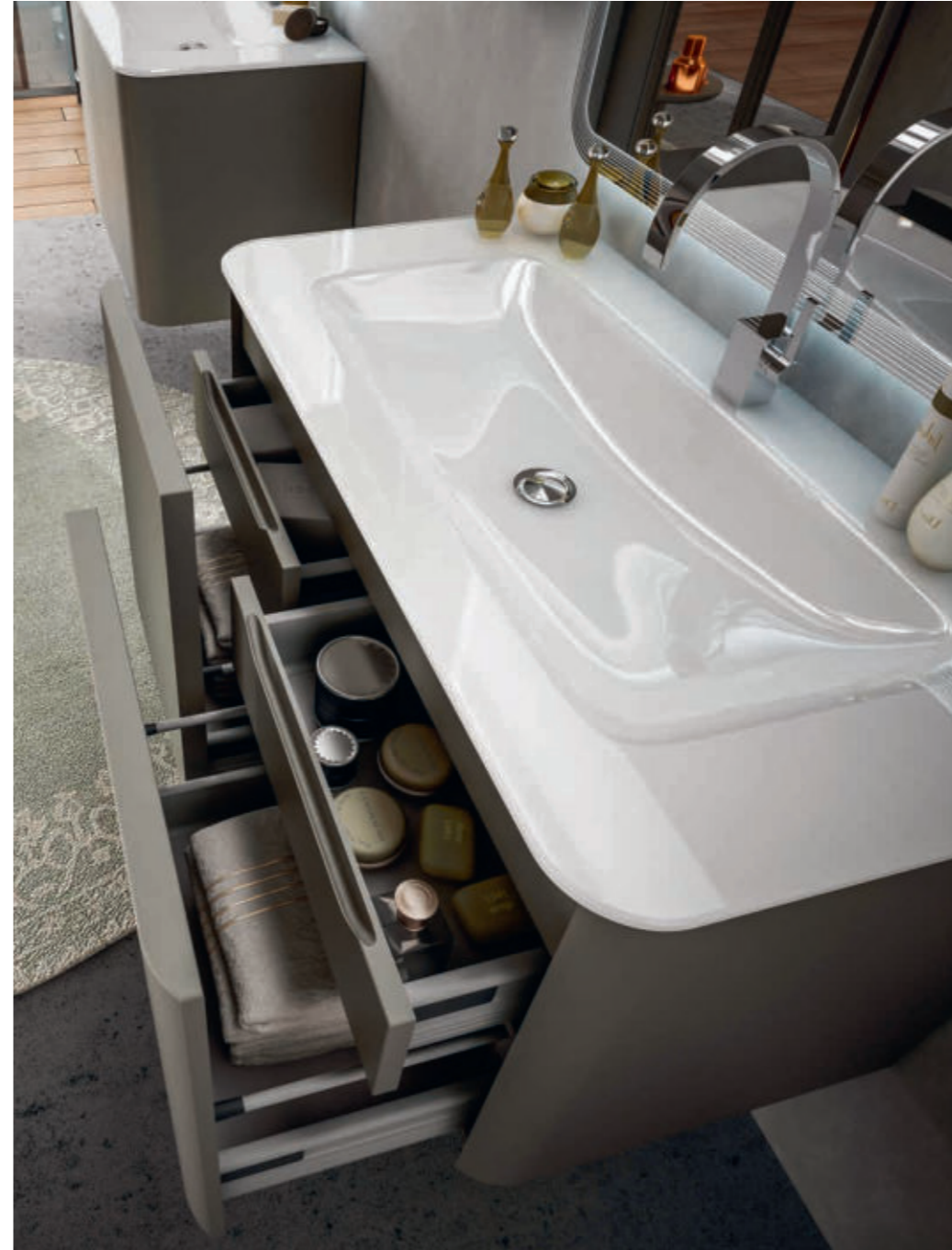
Grigio Talpa - Mole Gray - Gris Taupe - Talpagrau Liverpool