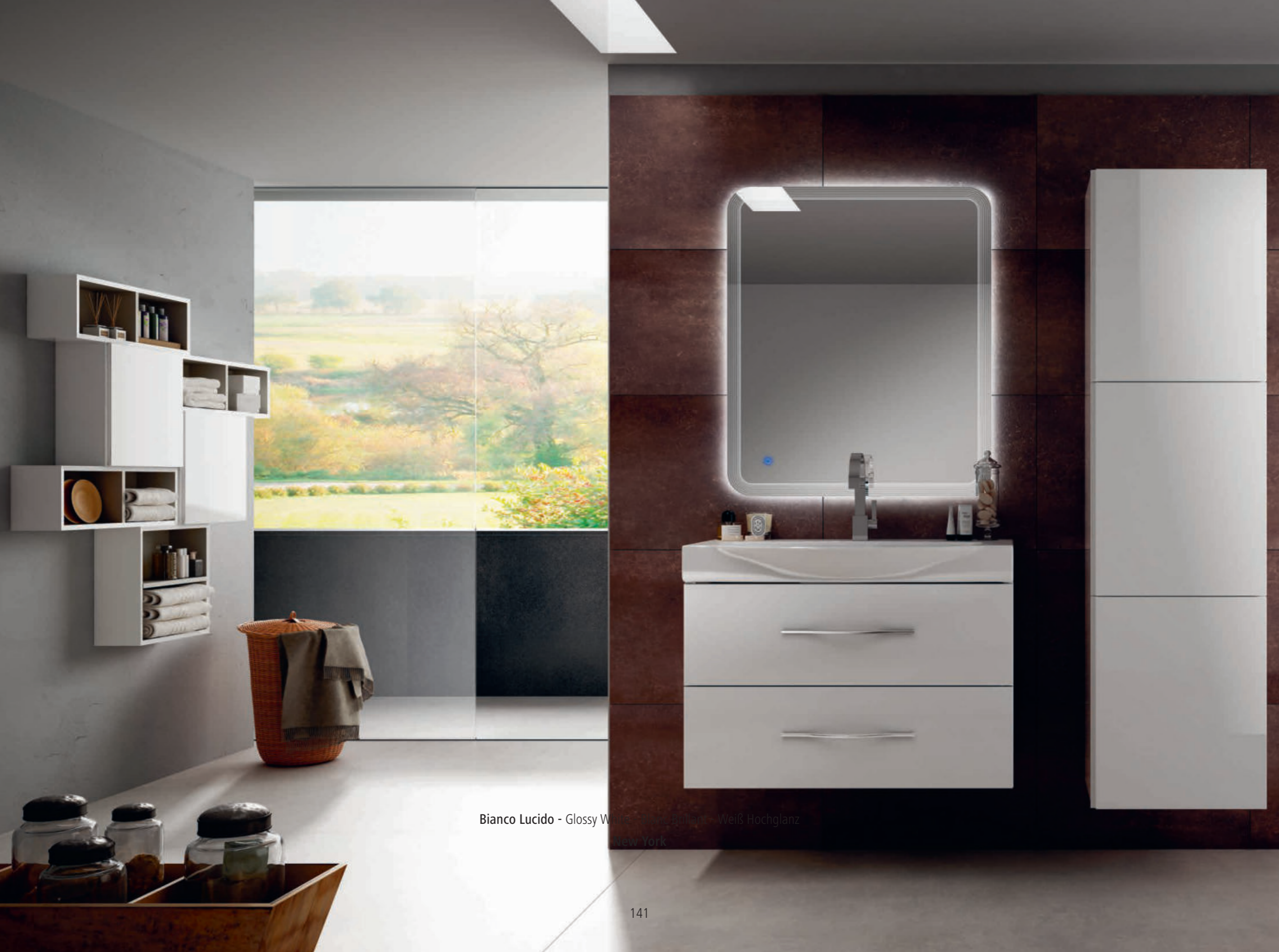
Bianco Lucido - Glossy White - Blanc Brillant - Weiß Hochglanz New York