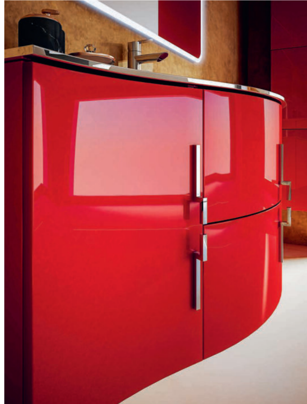
Rosso - Red - Rouge - Rot Sting