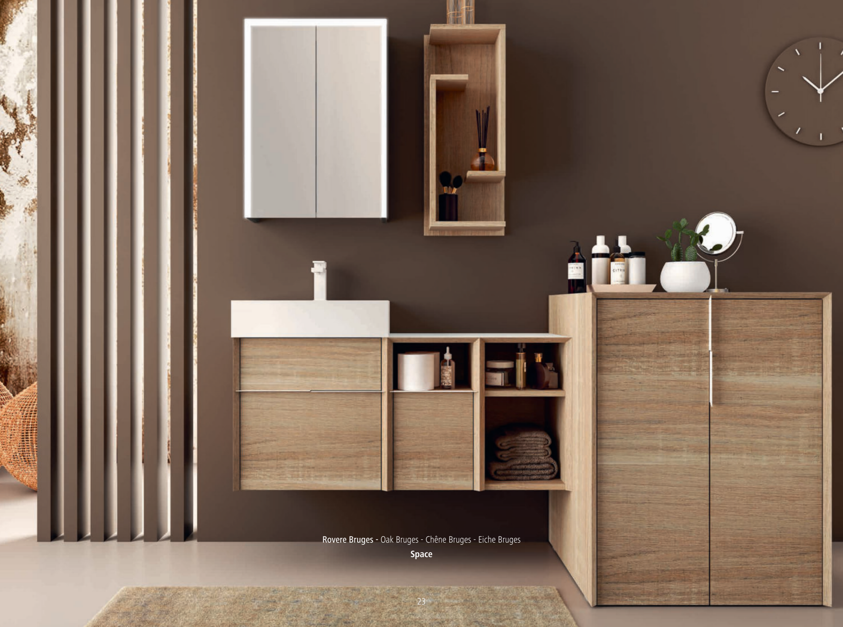
Rovere Bruges - Oak Bruges - Chêne Bruges - Eiche Bruges Space