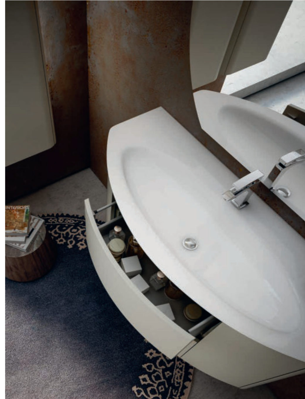
Grigio Natura - Nature Gray - Gris Nature - Natur Grau