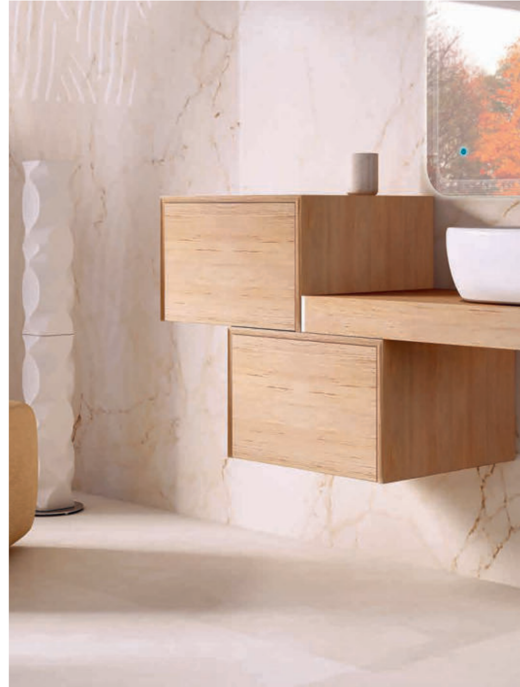
Rovere Tabacco - Tobacco Oak - Chêne Tabac - Tabakeiche Tavolone