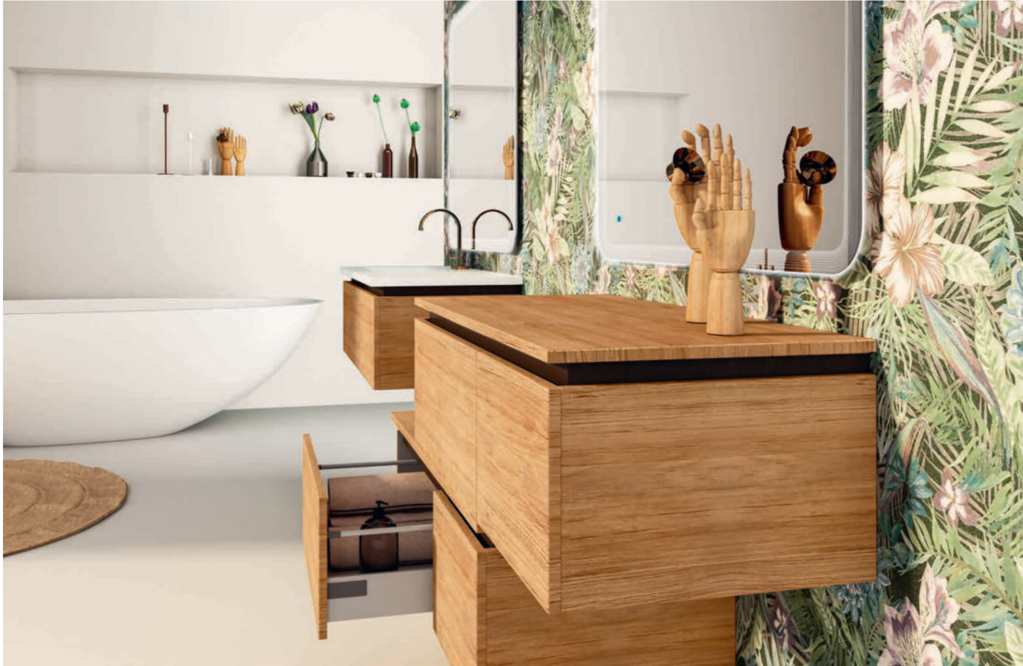
Rovere Tabacco - Tobacco Oak - Chêne Tabac - Tabakeiche Avril