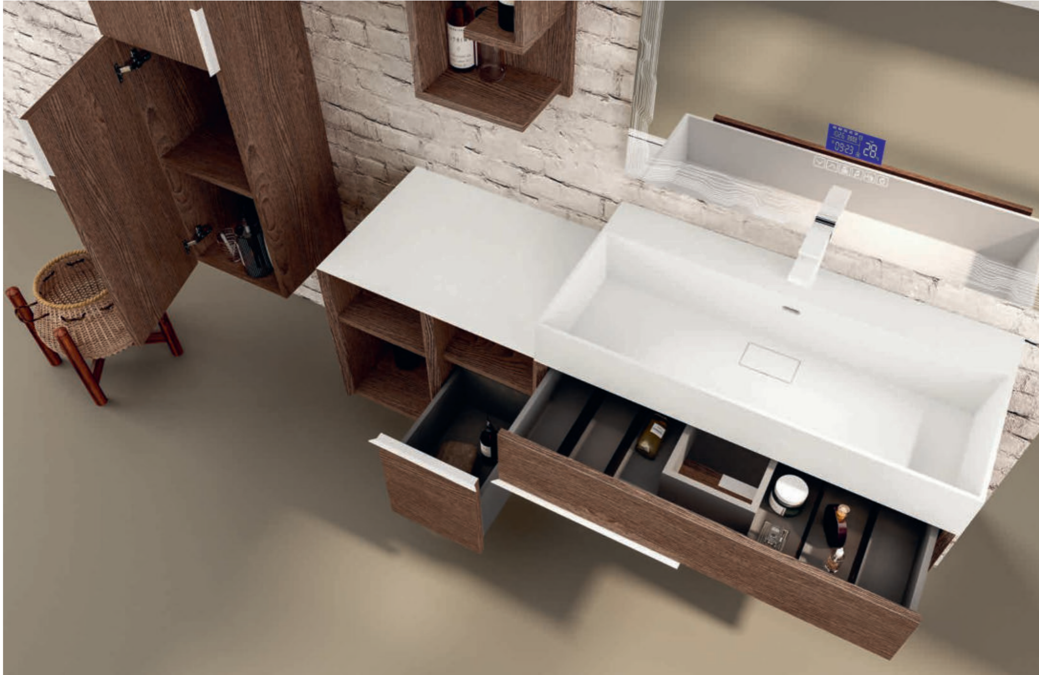
Frassino scuro - Dark Ash - Frêne Foncé - Esche Dunkel Space