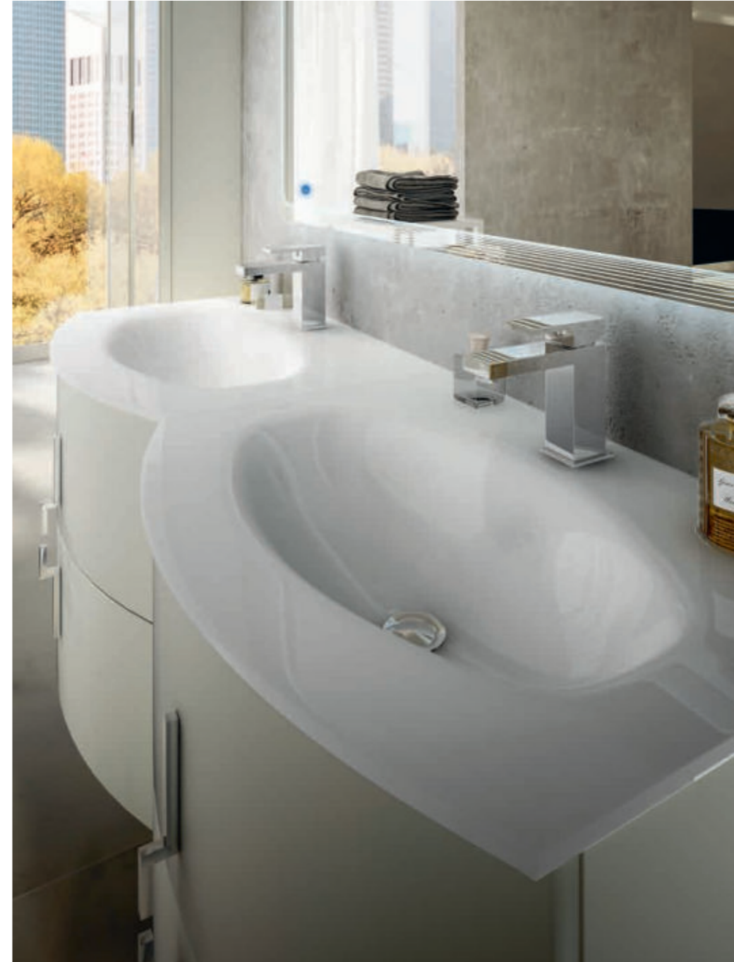
Grigio Natura - Nature Gray - Gris Nature - Natur Grau Sting