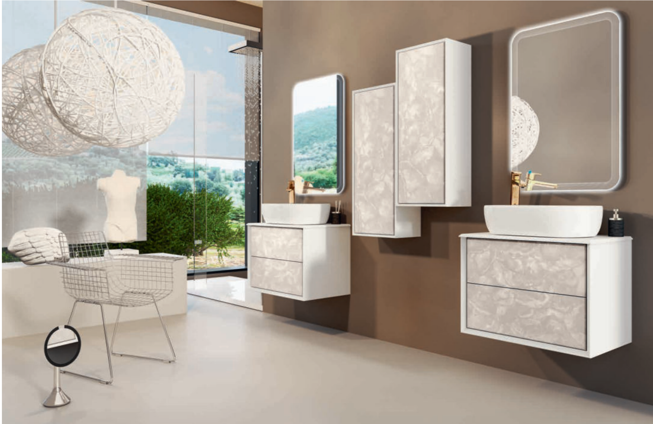
Light Onice Bellagio