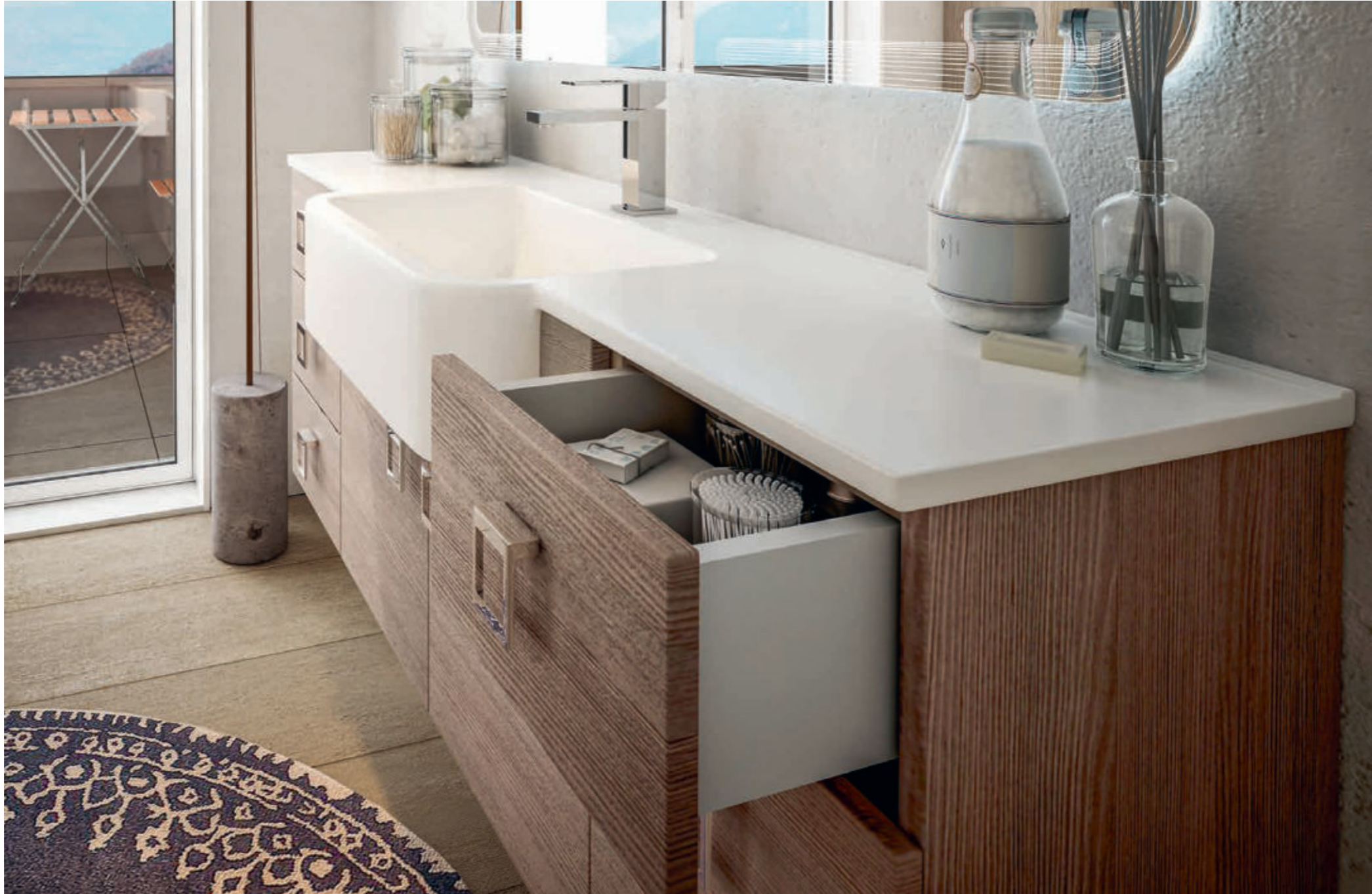
Larice - Larch - Mélèze - Lärche Florida