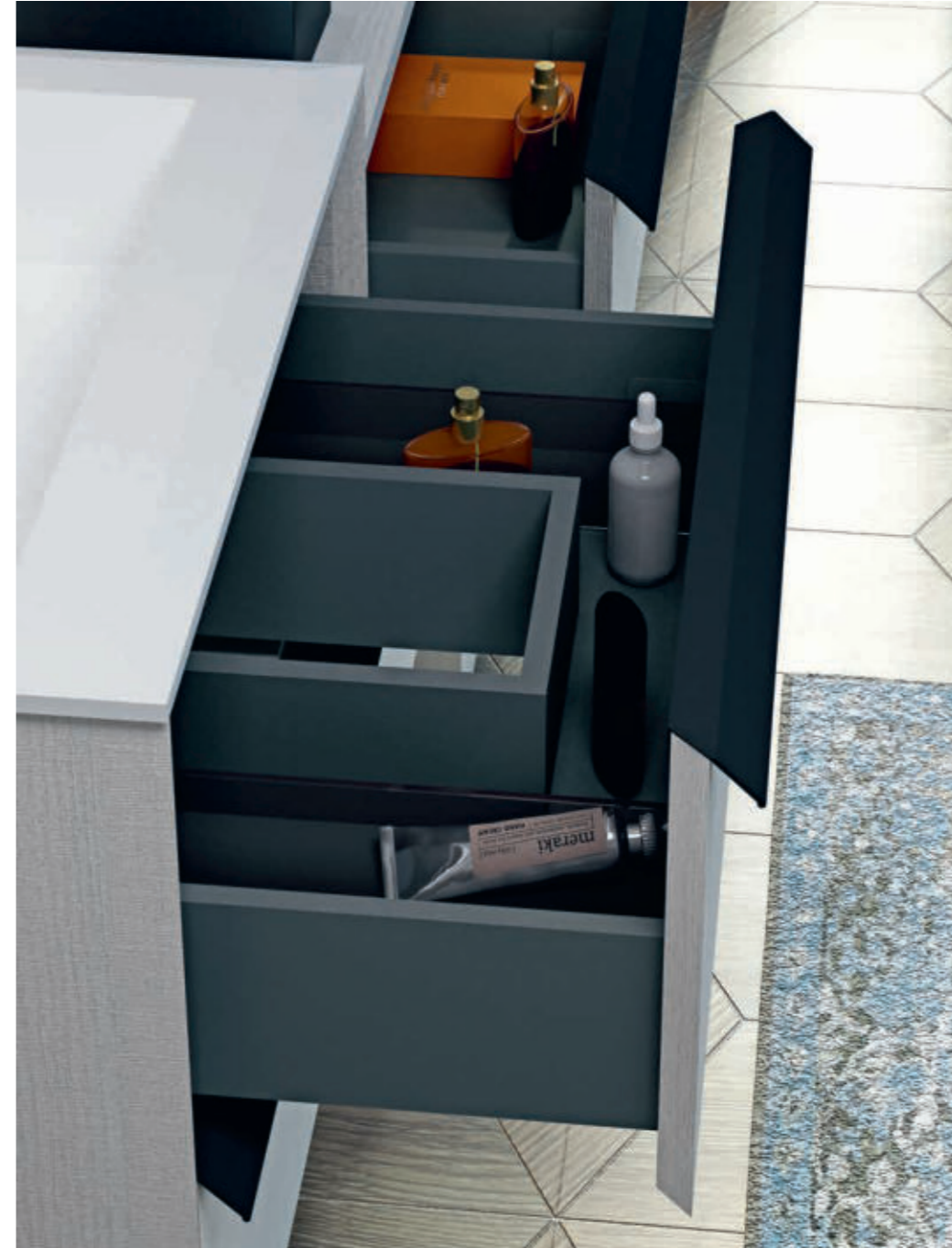
Bianco Rock - White Rock - Blanc Rock - Weiß Rock