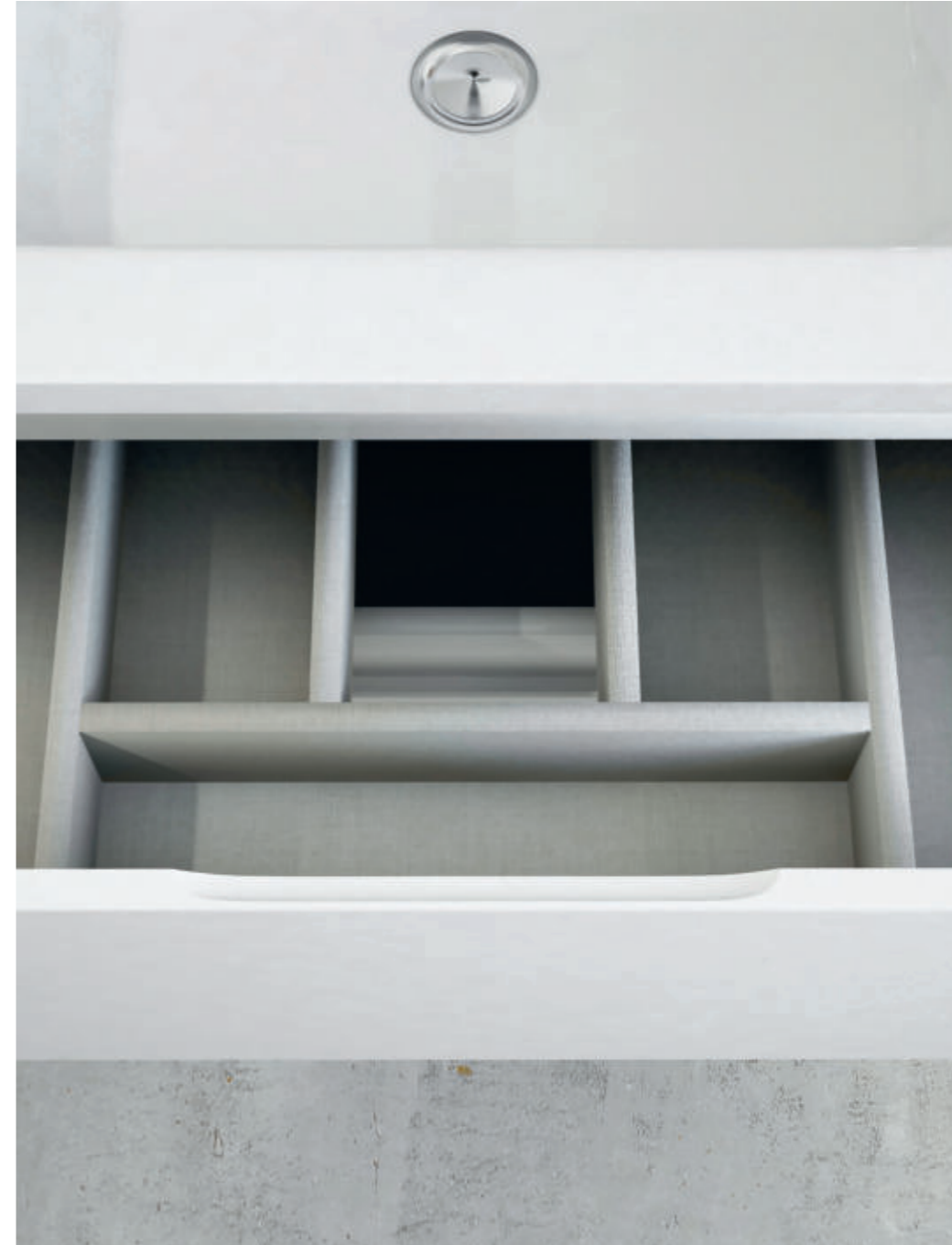
Bianco Lucido - Glossy White - Blanc Brillant - Weiß Hochglanz Glass