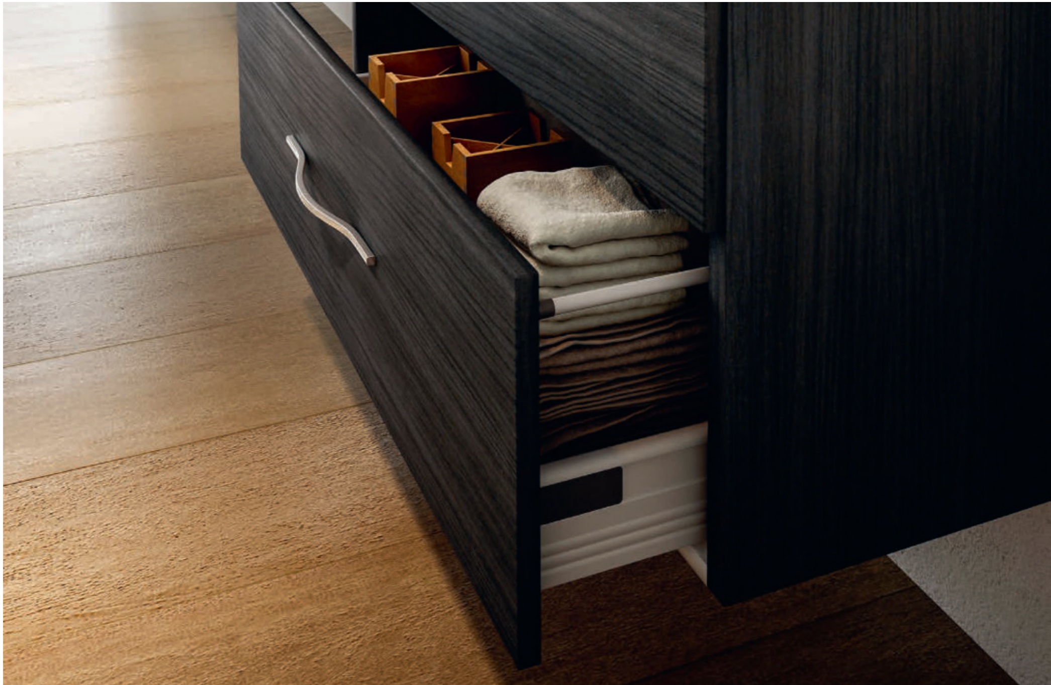
Grigio Scuro Venato - Dark Gray Veined - Gris Foncé Veiné - Dunkelgrau mit Linenstruktur New York