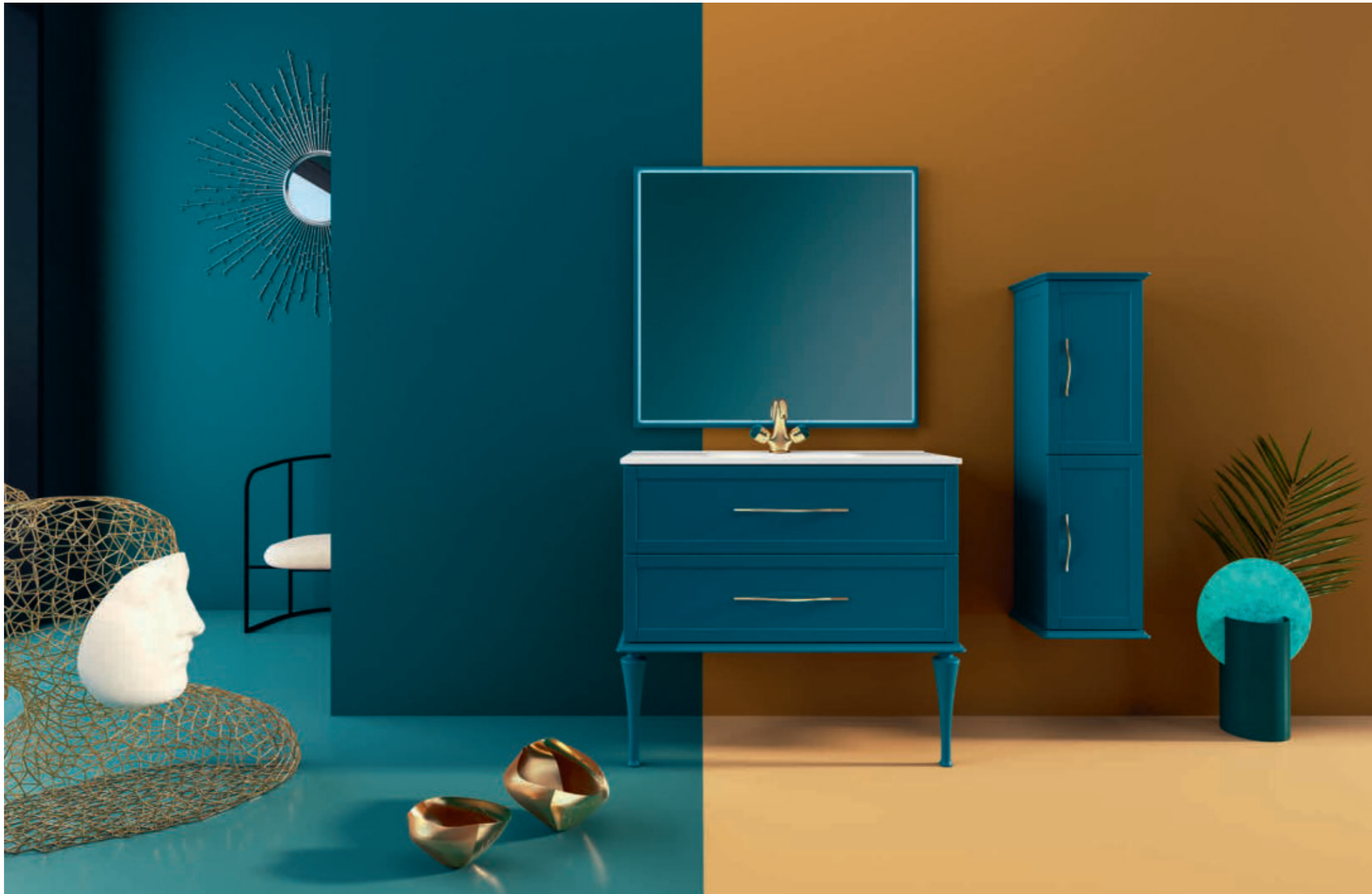
Blu petrolio - Petrol Blue - Bleu Pétrole - Petrolblau