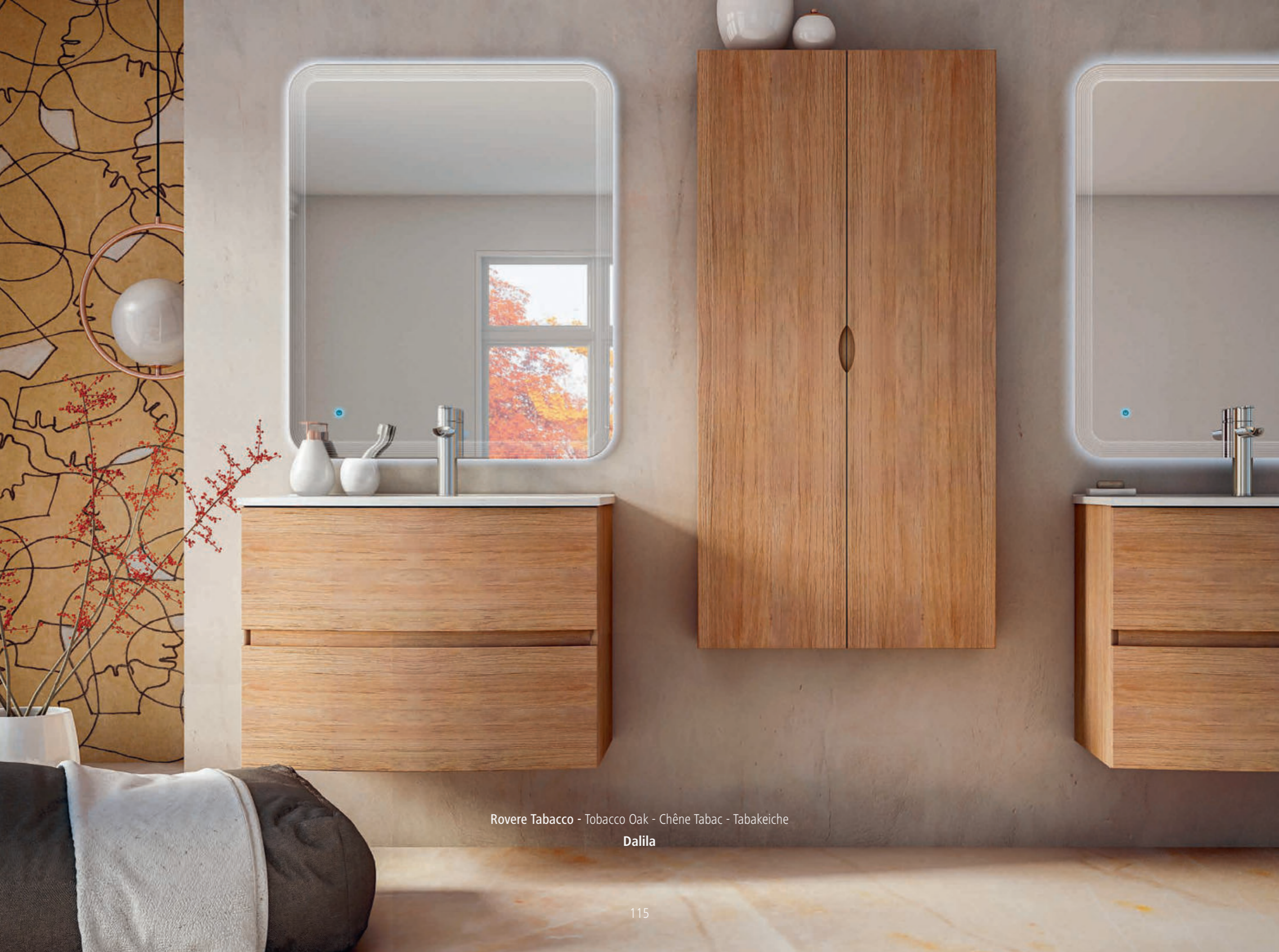
Rovere Tabacco - Tobacco Oak - Chêne Tabac - Tabakeiche Dalila