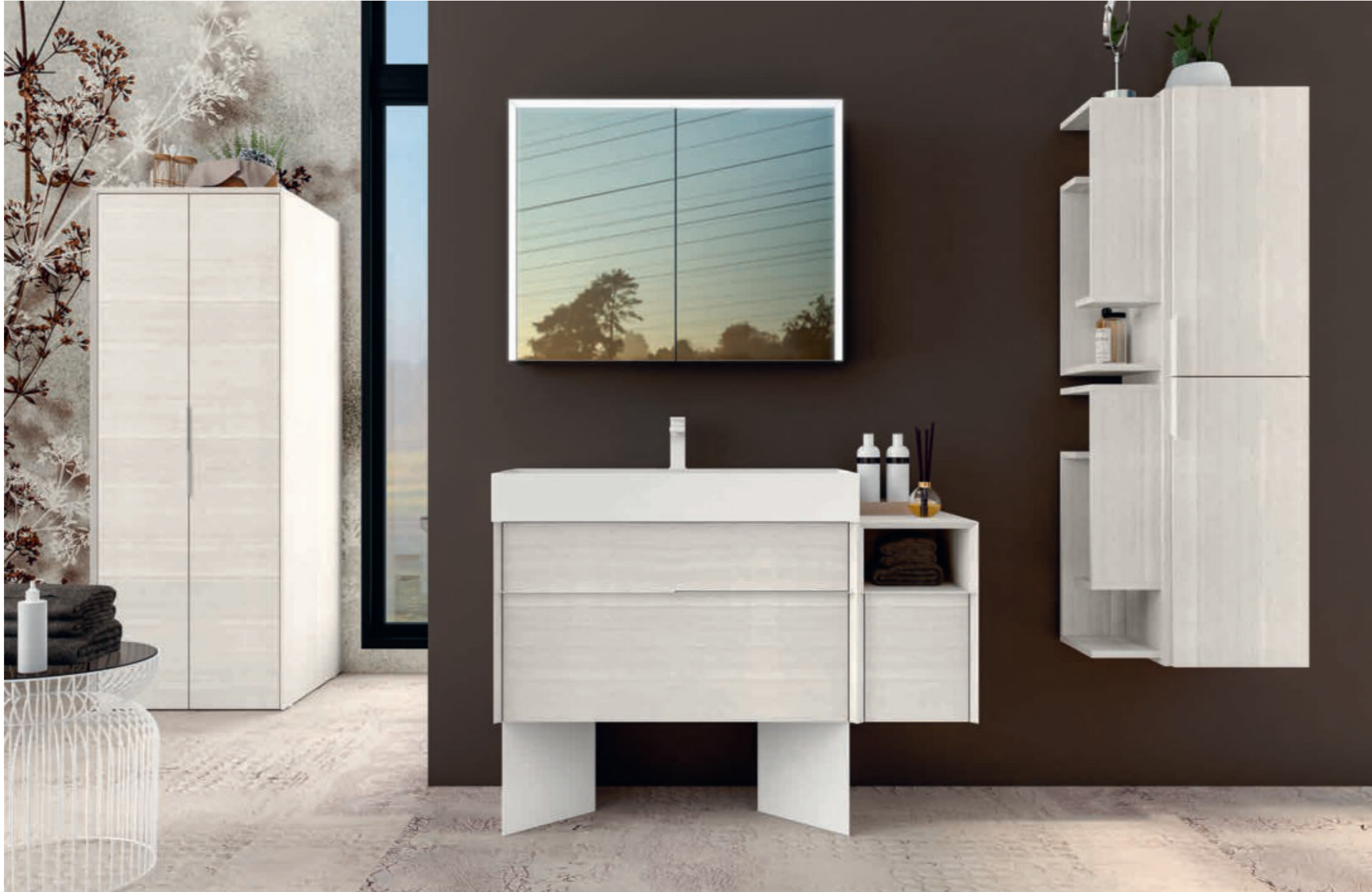
Bianco Rock - White Rock - Blanc Rock - Weiß Rock Space