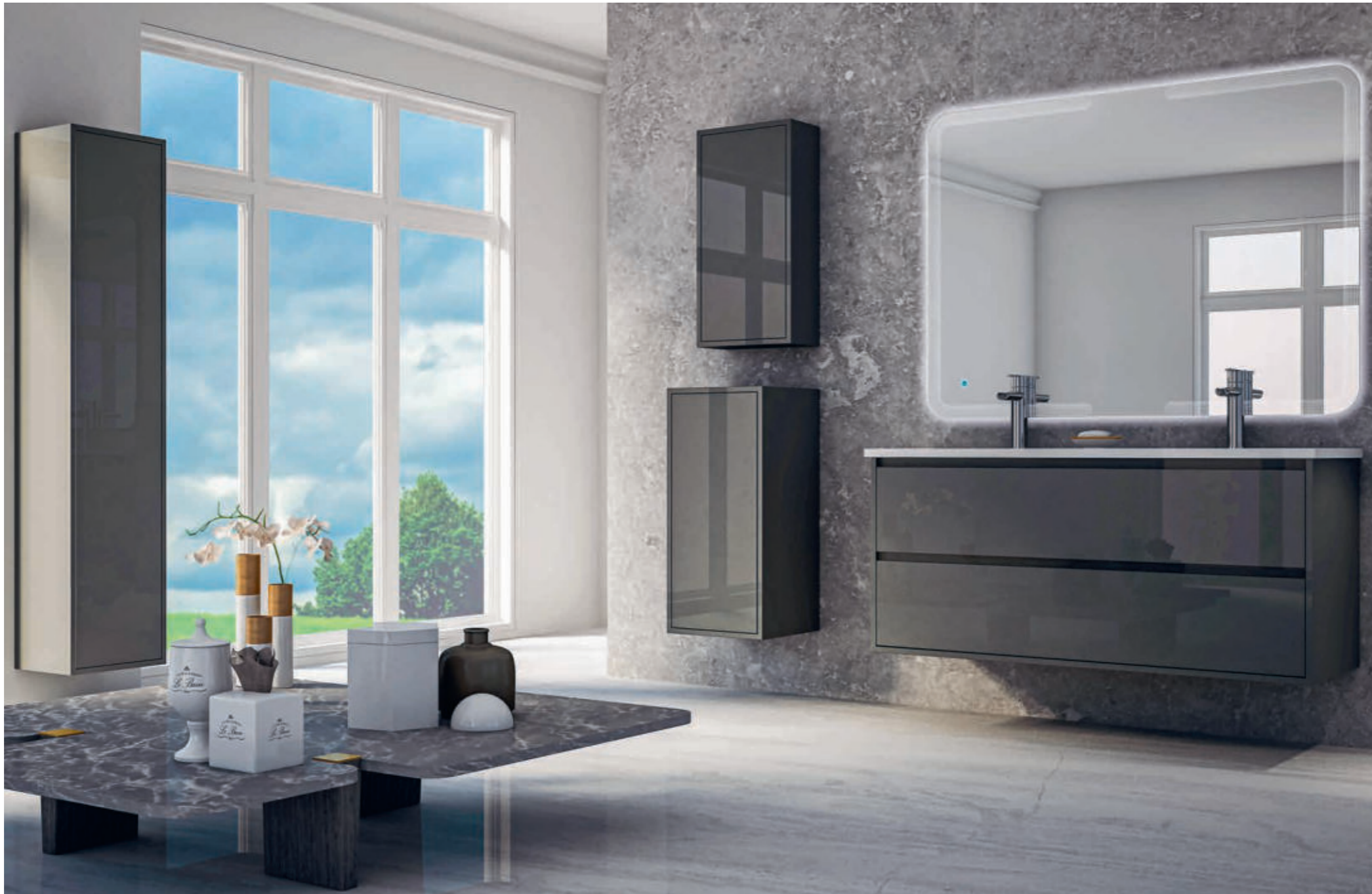
Antracite - Anthracite - Anthracite - Anthrazit Glass