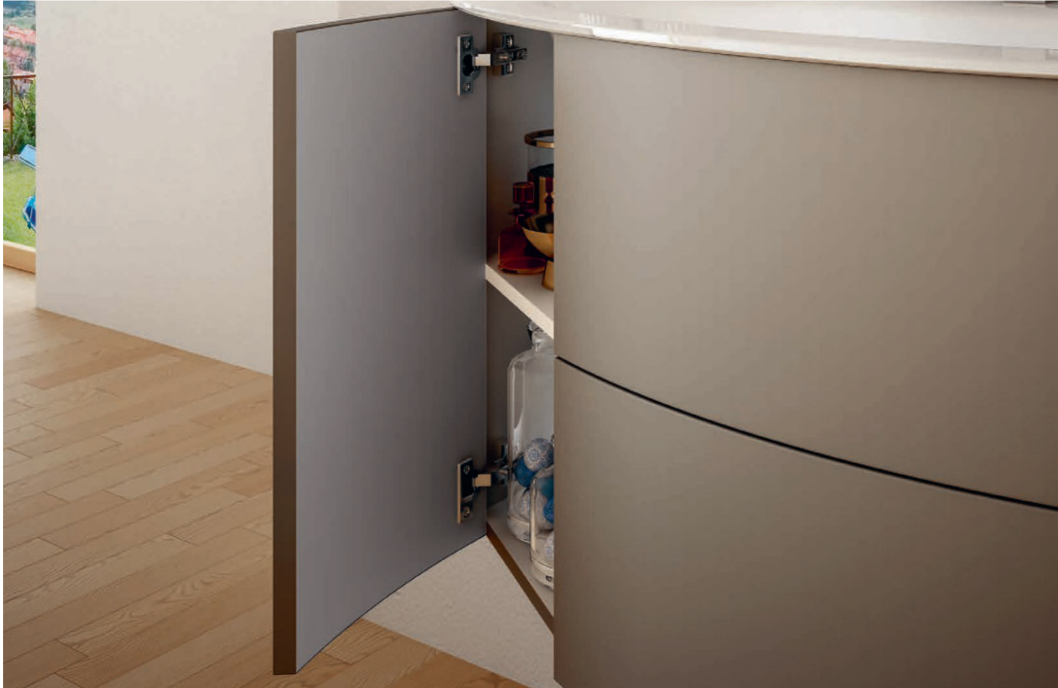
Grigio Talpa - Mole Gray - Gris Taupe - Talpagrau Eden