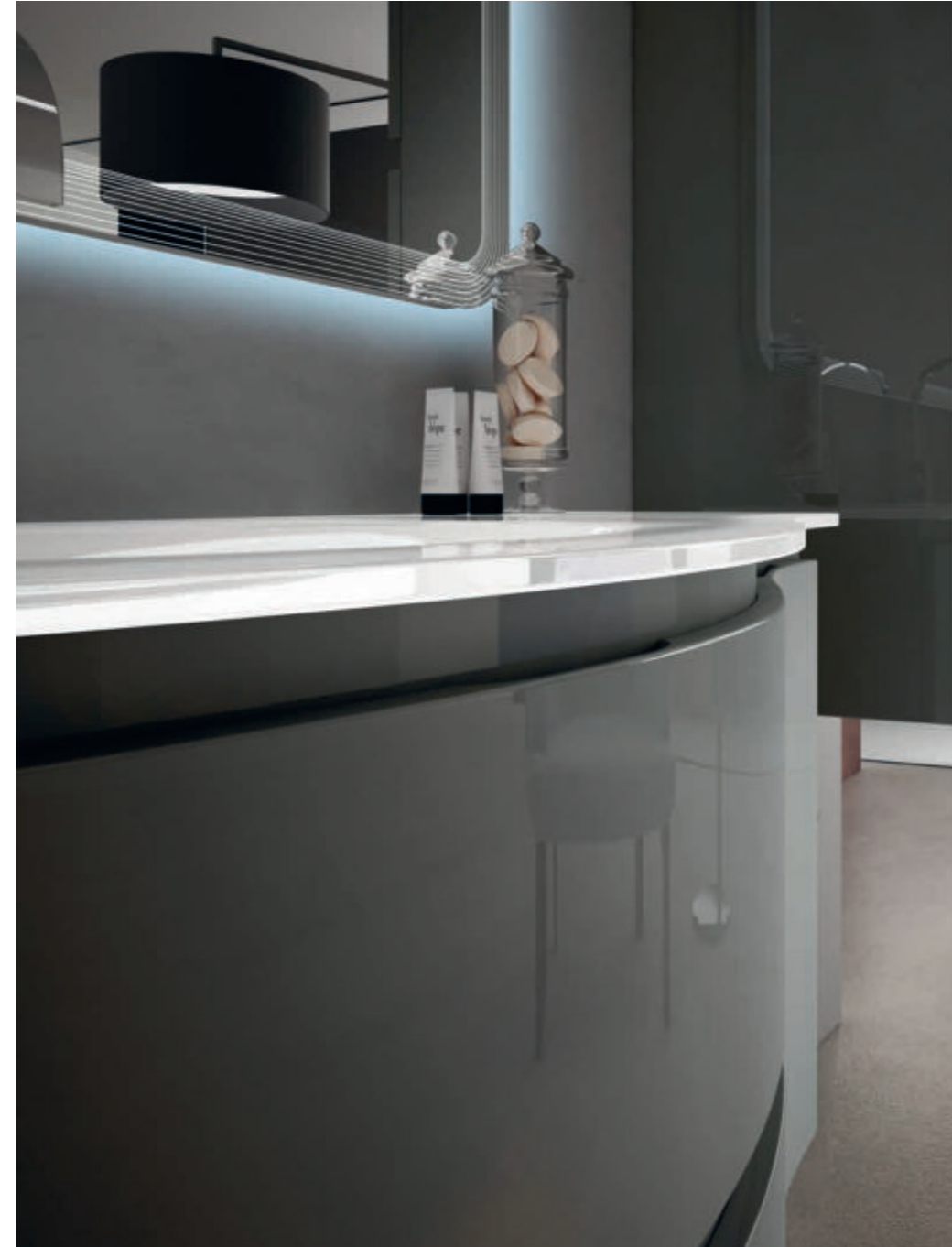
Antracite - Anthracite - Anthracite - Anthrazit Vague