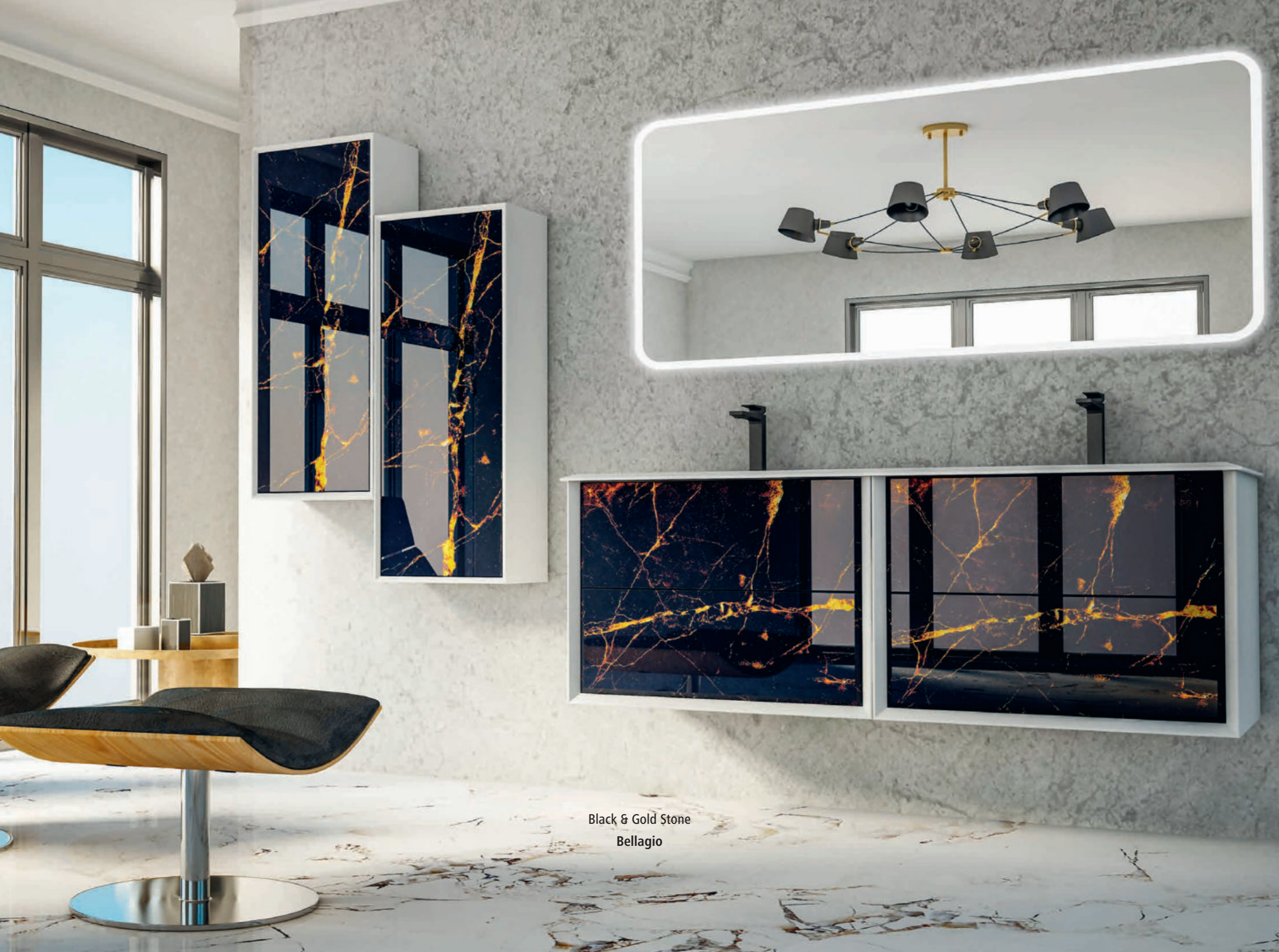
Black & Gold Stone Bellagio