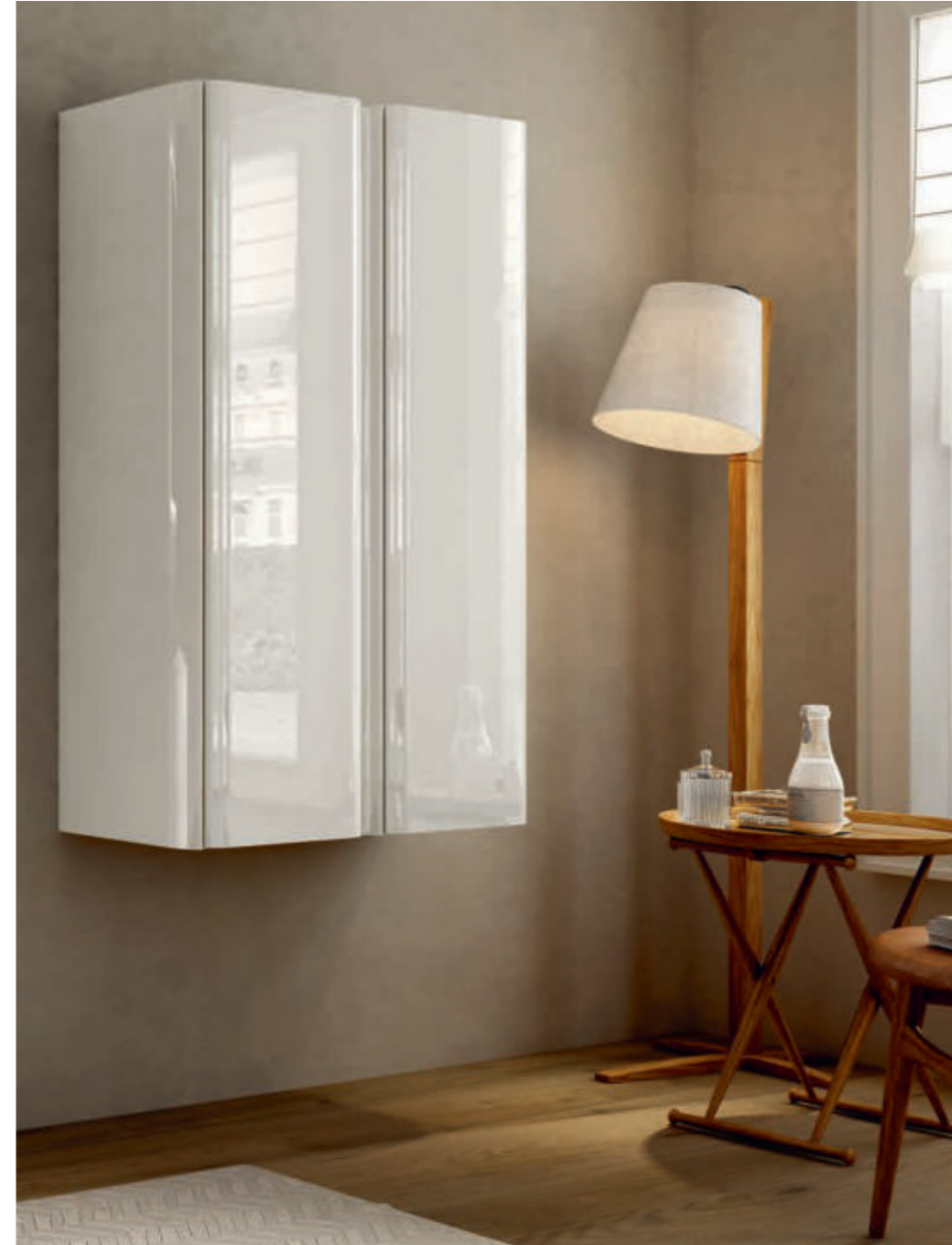
Bianco Lucido - Glossy White - Blanc Brillant - Weiß Hochglanz Liverpool