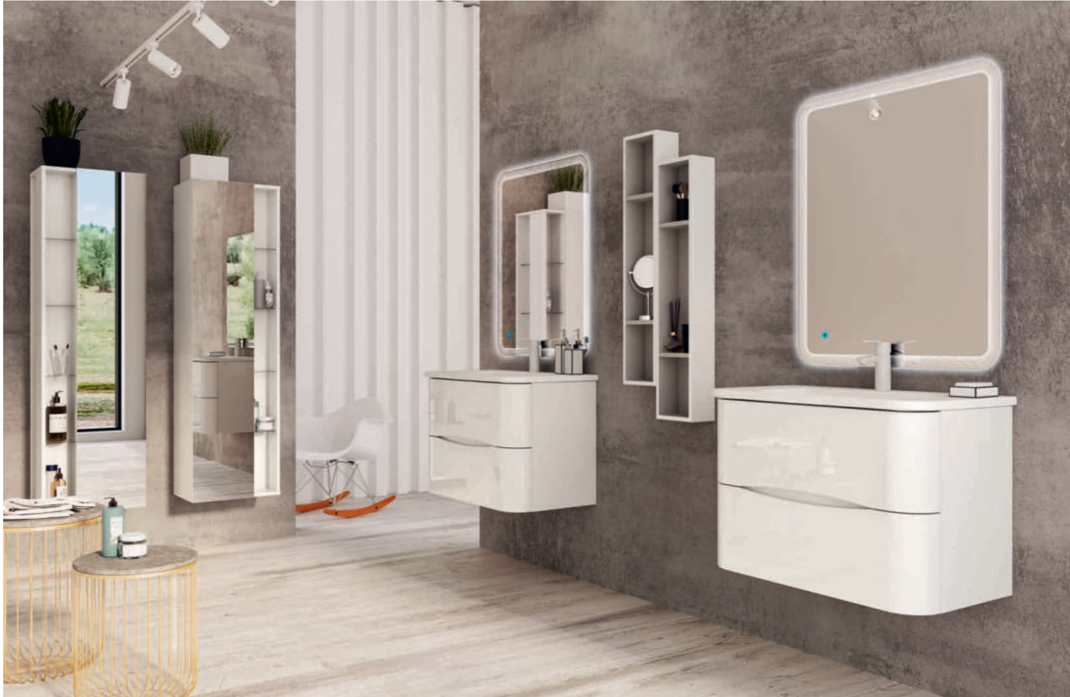
Bianco Lucido - Glossy White - Blanc Brillant - Weiß Hochglanz Angie