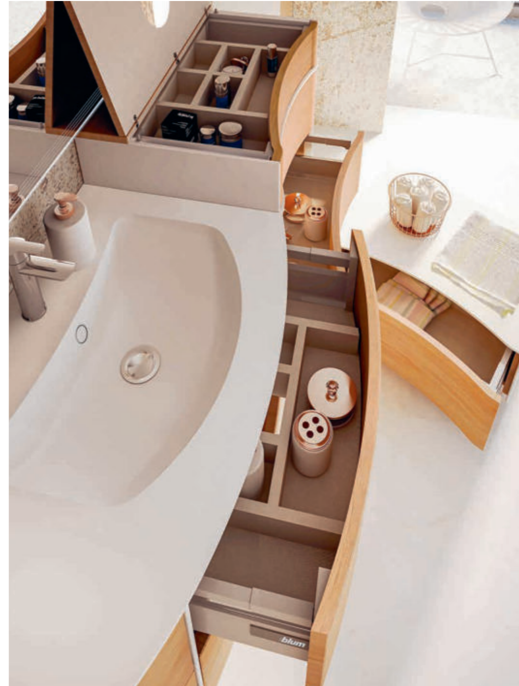
Rovere Tabacco - Tobacco Oak - Chêne Tabac - Tabakeiche Soho