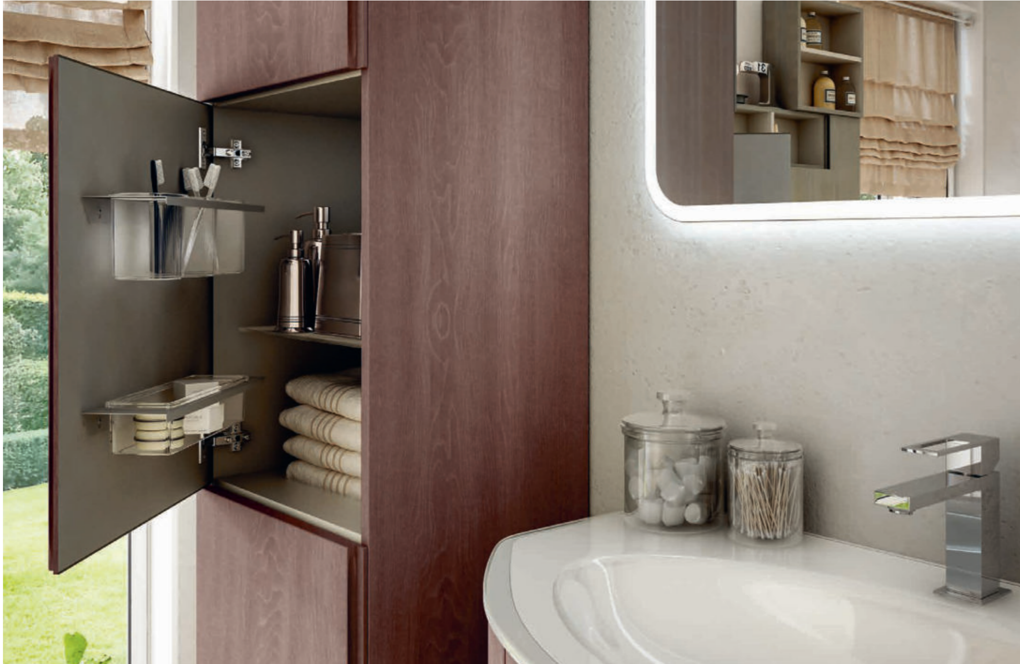
Rovere Scuro Soft - Dark Oak Soft - Chêne Foncé Soft - Eiche Soft Eden