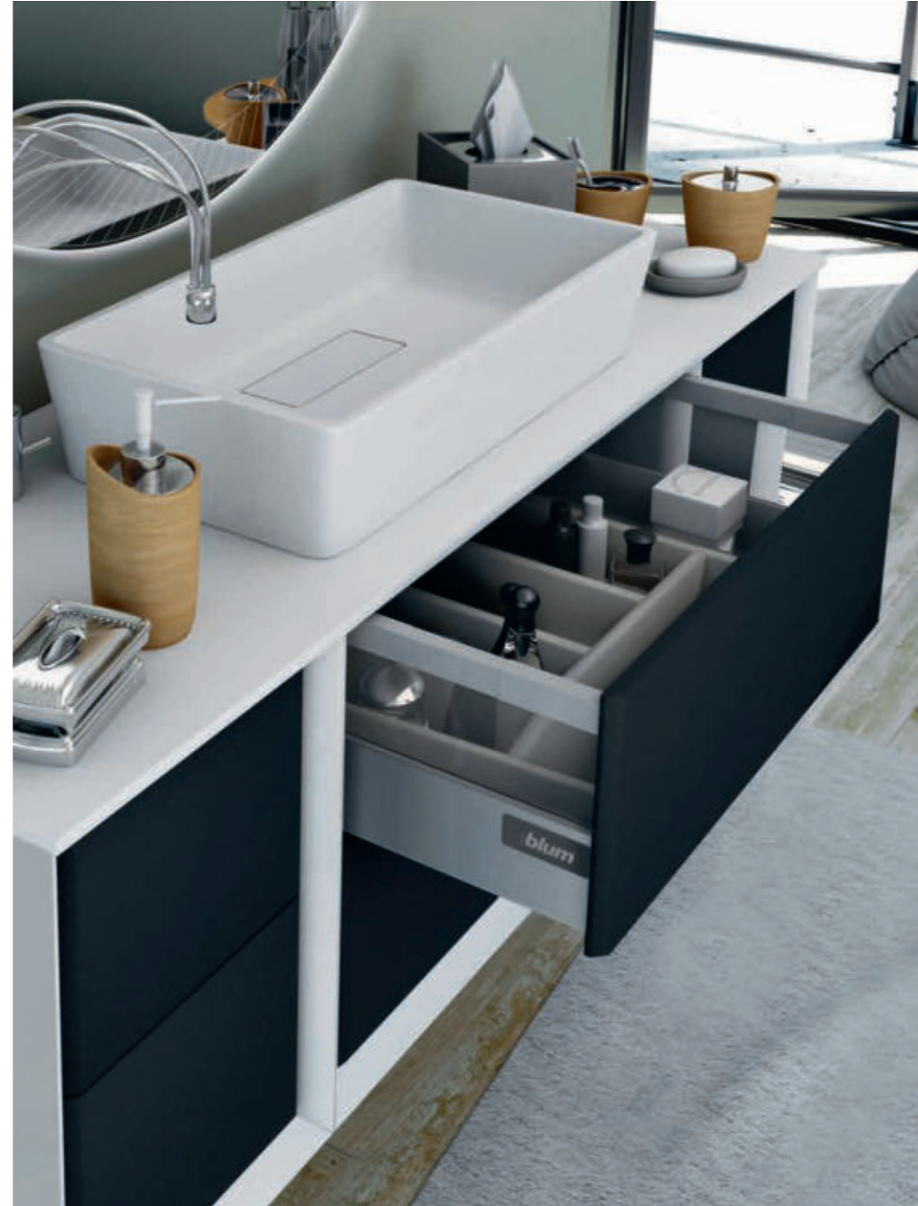
Grafite - Graphite - Graphite - Graphit Bellagio