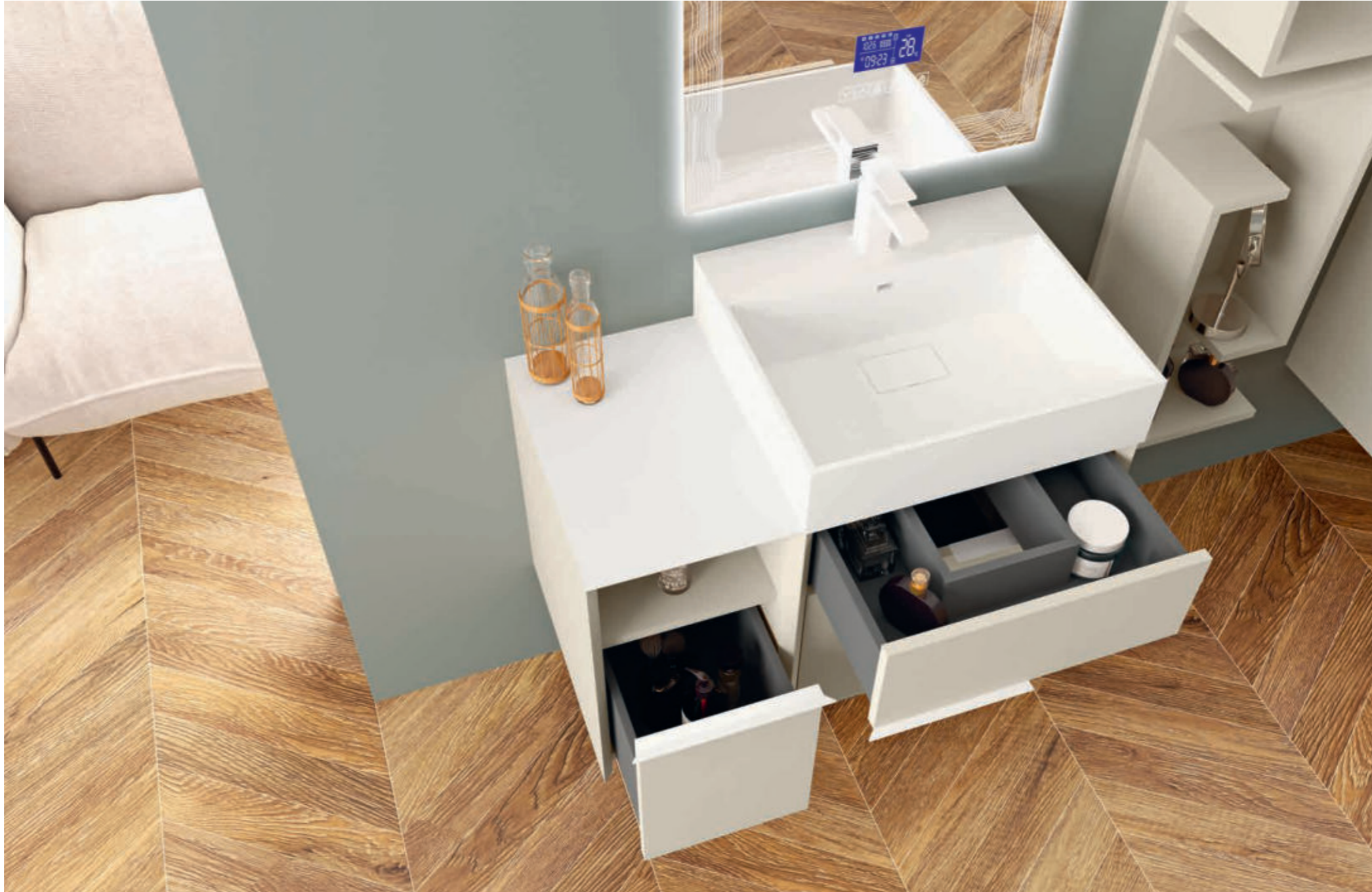
Spatolato bianco - Brushed White - Blanc Effet Taloché - Gebürstetes Weiß Space