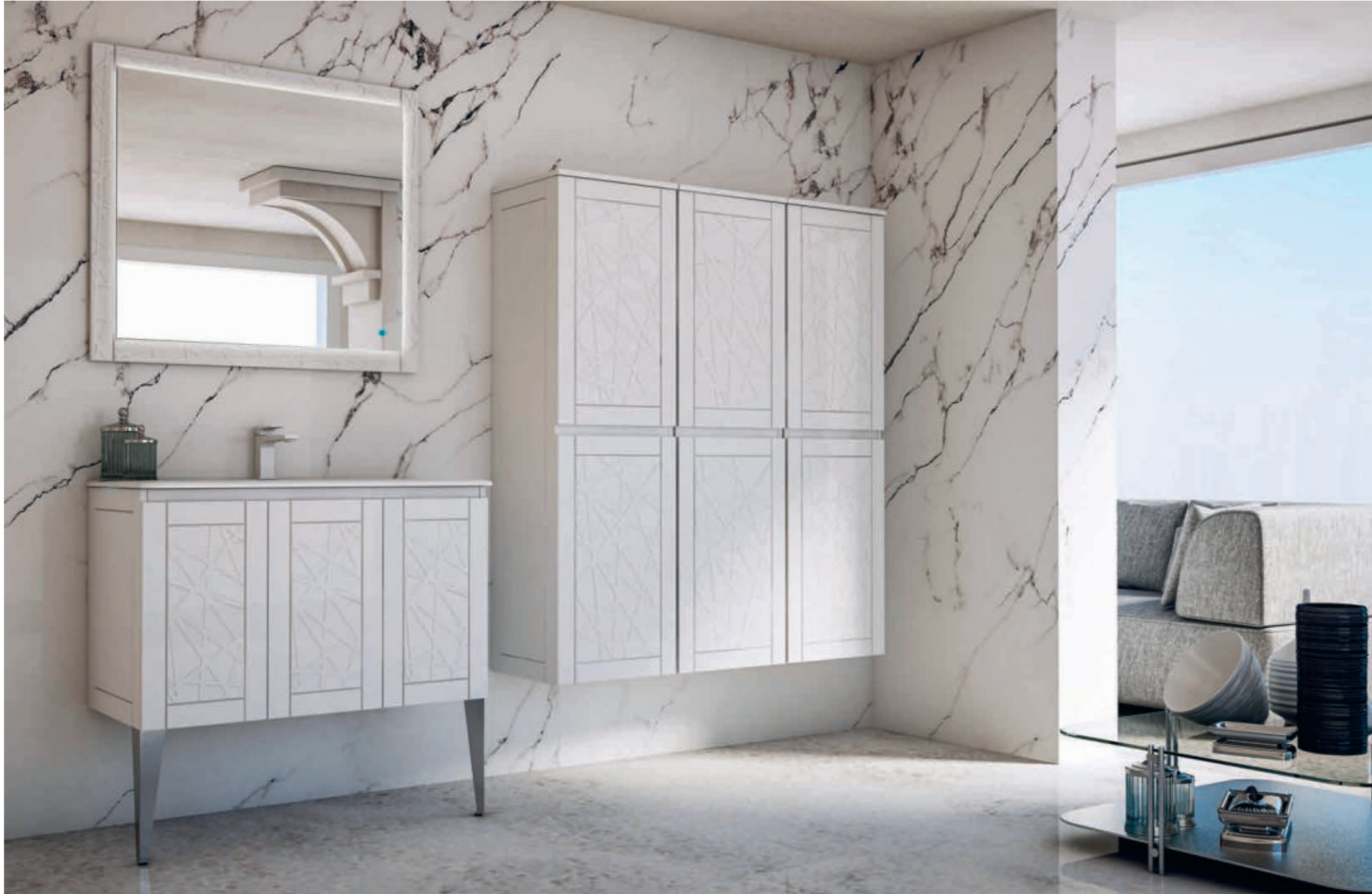
Bianco Opaco - Matte White - Blanc Mat - Weiß Matt America